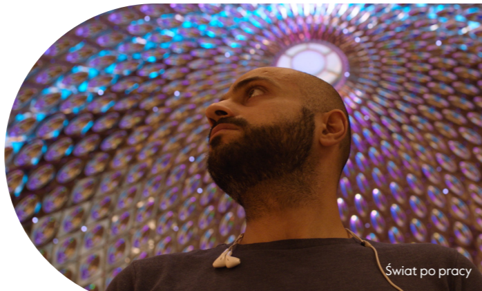
Świat po pracy

nauczyciel historii i wiedzy o społeczeństwie, koordynator Młodzieżowych Klubów Historycznych im. Kazimierza Moczarskiego, obecnie zajmuje się działaniami edukacyjnymi w Muzeum Historii Polski w Warszawie.