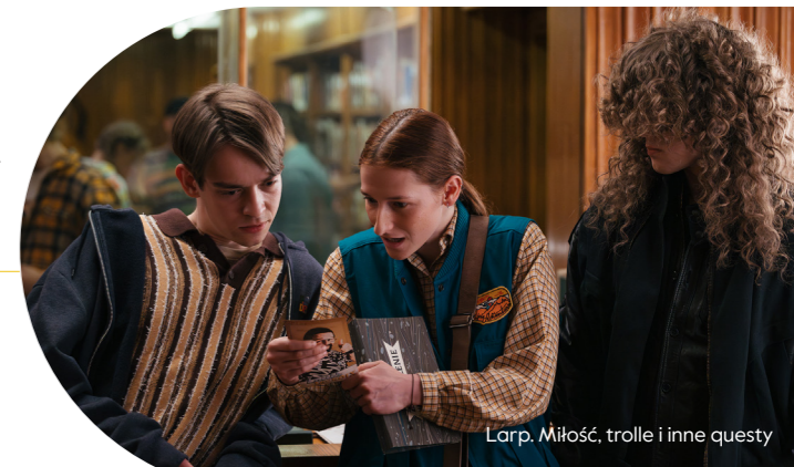
Larp. Miłość, trolle i inne questy

karta pracy: Motyw zbrodni w tekstach kultury – „Jestem mordercą” i „Zbrodnia i kara” Fiodora Dostojewskiego.