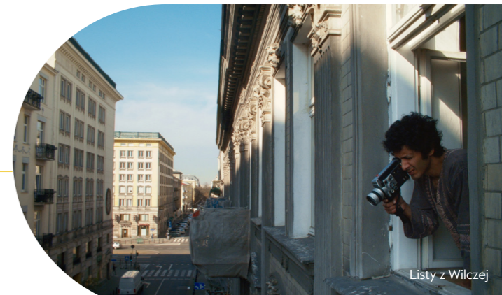
Listy z Wilczej