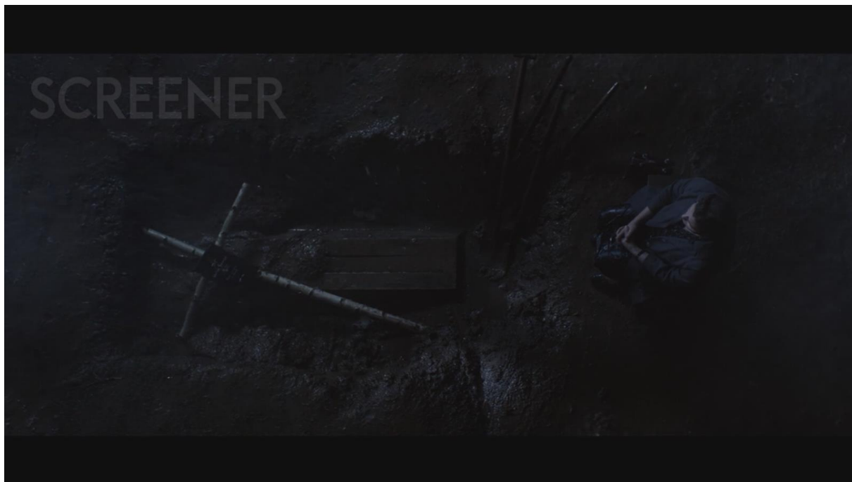
Kadr z filmu „Ułaskawienie”