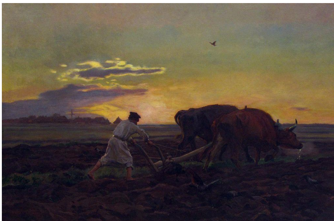
Józef Chełmoński „Orka” (1896)