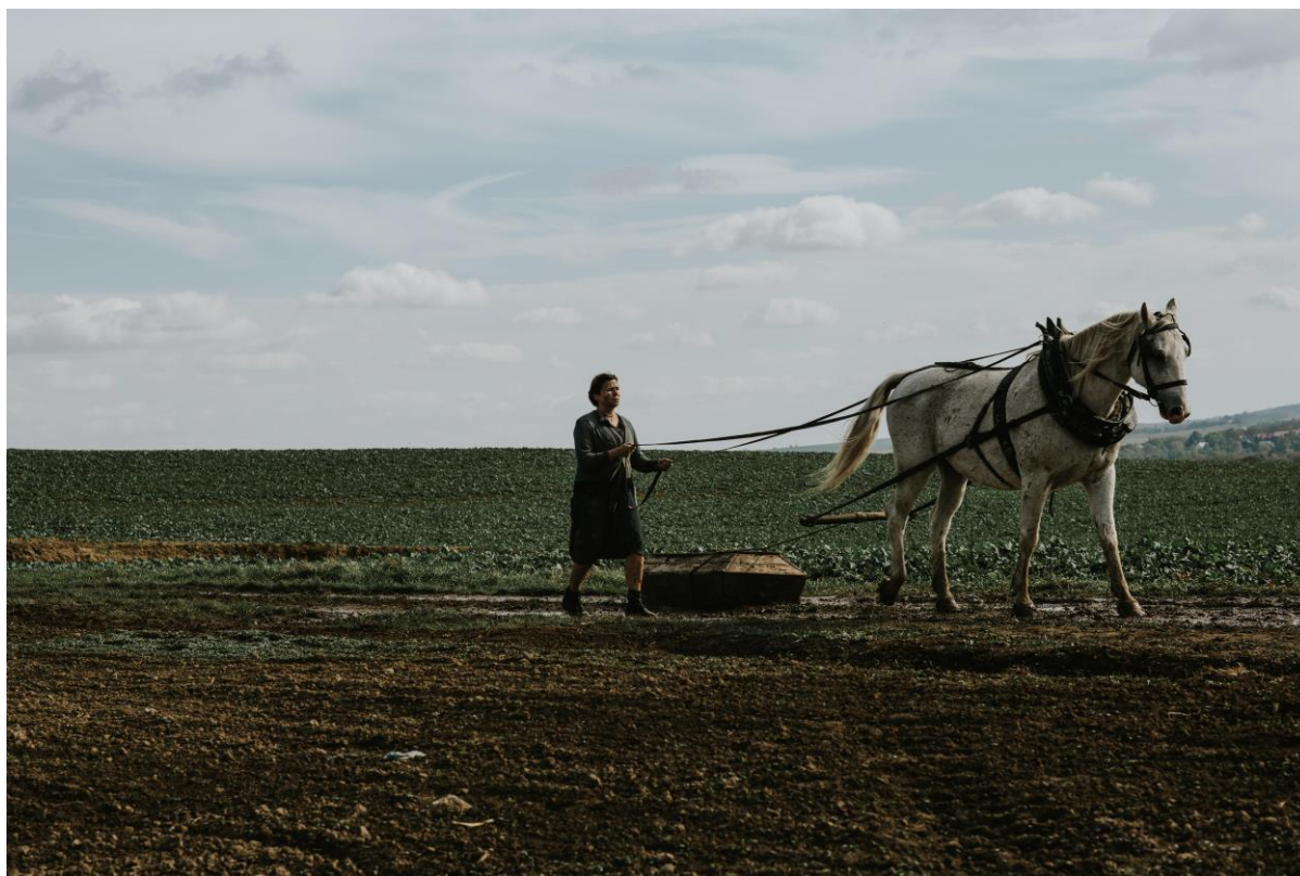
Kadr z filmu „Utaskawienie”