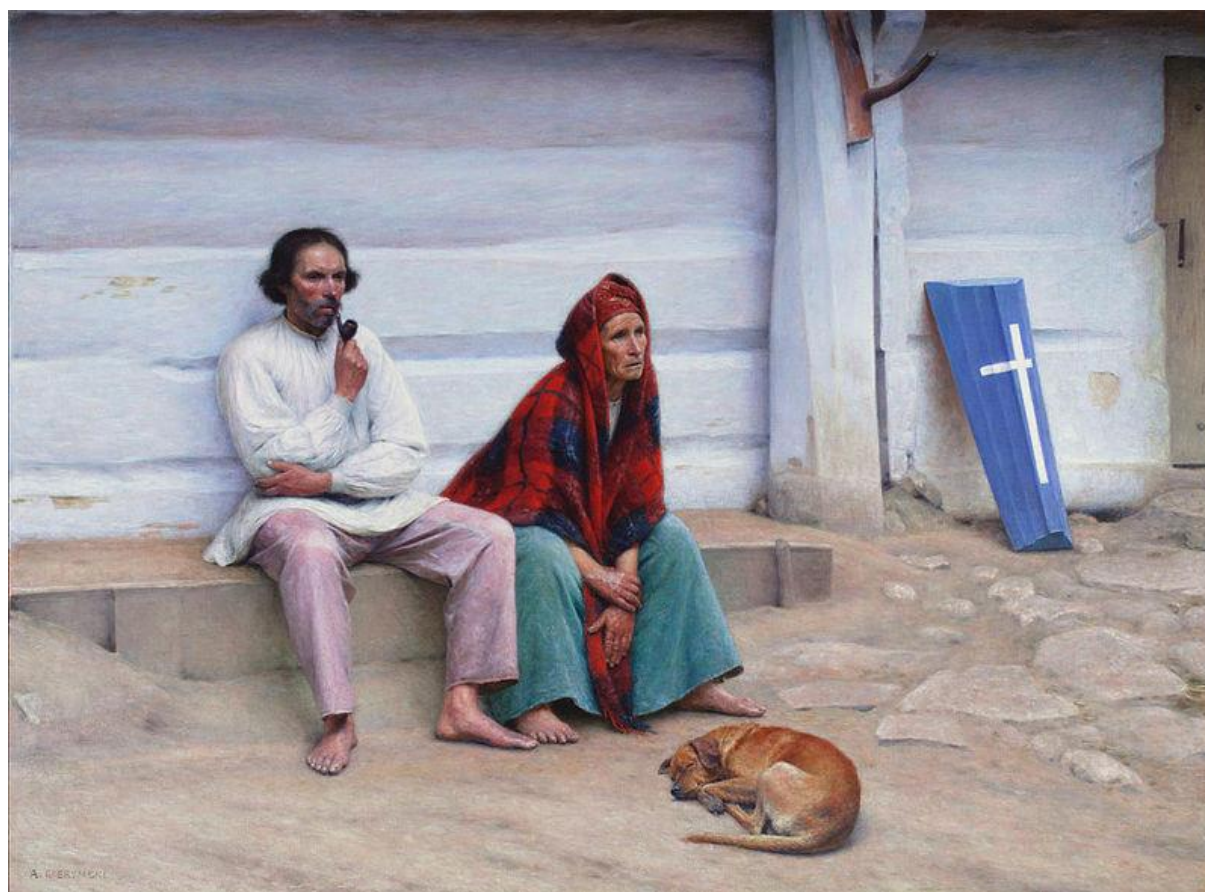
Aleksander Gierymski „Trumna” (1894)